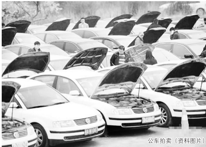
公车拍卖（资料图片）

2月17日上午，国家发改委新闻发言人赵辰昕在例行新闻发布会上表示，我国不会出现新一轮“失业潮”。另外，在回应人民币会不会继续贬值时，赵辰昕表示，我国有能力继续保持人民币汇率在合理均衡水平上的基本稳定。