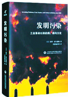
《发明污染:工业革命以来的煤、烟与文化》 【美】彼得·索尔谢姆 著 上海社会科学院出版社2016年1月版

工业革命时期,英国伦敦工厂里一排排烟囱,排放出浓黑的煤烟,曾经被认为是社会进步的标志。当时这座世界著名的大都市天空整天灰蒙蒙的,被称为“雾都”。煤烟带来一系列的生态环境问题,给市民的健康带来严重危害,如何看待煤烟、又该如何治理空气污染,英国社会的各利益阶层为此展开过漫长的博弈。《发明污染:工业革命以来的煤、烟与文化》这本书,对此进行了细致入微的还原。