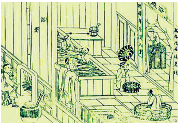
清代澡堂门旁对联：“杨梅结毒休来浴，酒醉年老莫入堂”