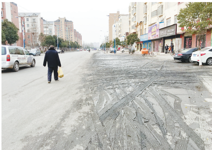
□文/图 见习记者 李林润