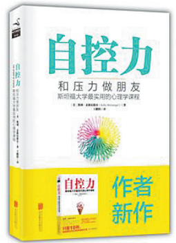
【美】凯利·麦格尼格尔 著 北京联合出版公司2016年版

作者在本书中提出：压力就是你在乎的东西发生危险时引起的反应。这个定义足够大，可以涵盖交通阻塞引起的沮丧和失去事物的痛楚。它包括感到压力时的想法、情绪、生理反应，以及你选择怎样应对压力情境。这个定义也强调了有关压力的一个重要真相：压力和意义无法分割。对不在乎的事情，你不会感到压力；不经受压力，你也无法开创有意义的生活。