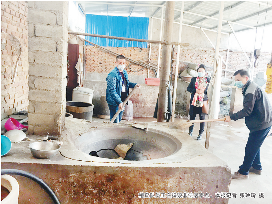
稽查队员正在捣毁非法屠宰点。

本报讯(记者 张玲玲)3月28日,“隐身”于107国道与长江路交叉口附近一条小巷里的非法屠宰点被捣毁,查获的200多斤生猪肉已被进行无害化处理,涉案人员正在接受调查。