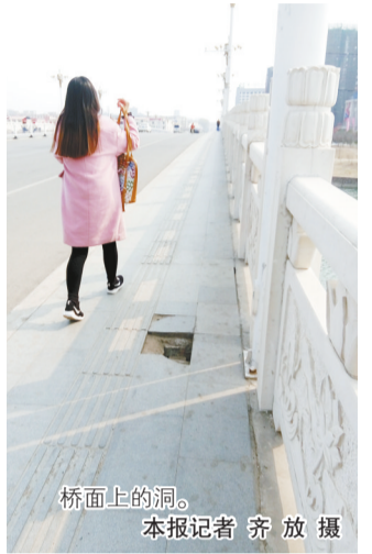
桥面上的洞。

人行道上有个洞,会注意避开。但是,对于一些小孩子和走路只顾玩手机的年轻人来说,是非常危险。”市民潘女士担心地说,“特别是到了夜晚,大家都出来散步。如果老年人不小心踩空,后果可能很严重。希望有关部门能派人尽快修补一下。”