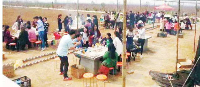
欢乐吃烧烤。

本报讯(记者 徐赫)3月26日上午,十几个小记者家庭来到沙澧春天生态园,一起参加春游、烧烤活动。小记者们有的采摘草莓,有的跑到桃花丛中拍照,有的则在草坪上荡着秋千。