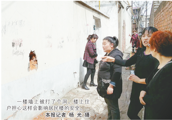
一楼墙上被打了个洞,楼上住户担心这样会影响居民楼的安全。

网吧里的一名施工人员告诉记者,500平方米以上的网吧要有消防通道,在墙上打洞就是为了开辟消防通道。最初在北边墙上打洞,