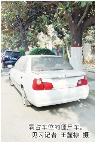
霸占车位的僵尸车。

“这辆车停在停车位上已经很长时间了，如果不近距离仔细看，你根本看不出是一辆僵尸车，车胎都瘪了，车身上落满了很多灰尘，真是太碍眼了。”市民张先生告诉记者，“附近这里有几所学校，车流很大，本来停车位就很紧张，这个僵尸车又霸占了一个停车位，多影响市民停车啊，还是快把它拖走吧，这样还