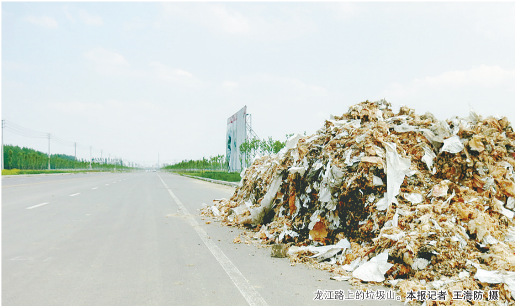
龙江路上的垃圾山。

本报讯（记者 王海防 见习记者 杨淇）昨日下午，路过龙江路西段的市民发现，一座垃圾山出现在龙江路上。由于路段偏僻，往来行人车辆稀少，几乎无人知道这座垃圾山是从何而来。