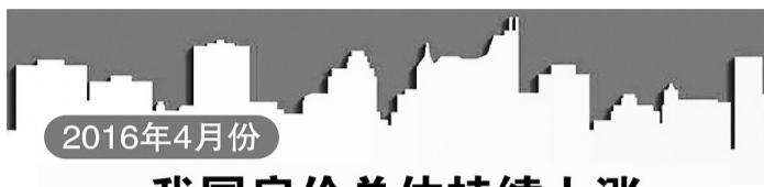
2016年4月份70个大中城市住宅销售价格变动情况

他说，PPI的变化有多重因素影响，包括期货市场的刺激，还有国际原材料市场比如原油等价格的回升。但是，从总体看，国内原材料供过于求的状况没有实质性