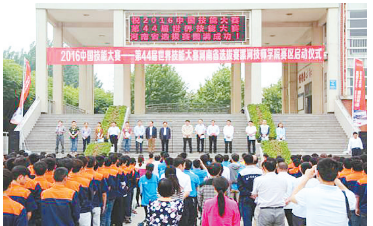
5月20日,第44届世界技能大赛河南省选拔赛在漯河技师学院赛区举行,来自全省17所技工院校的选手参加本次比赛。