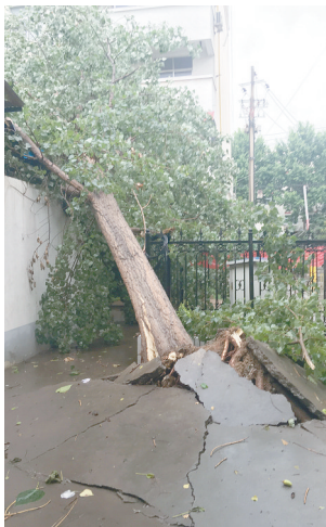
被风刮倒的大树。

本报讯（见习记者 王麓棣）6月19日下午，市区开始持续降雨并伴有大风，位于大学路广电小区内一棵老杨树被连根拔起，由于枝叶茂盛，树木倒向小区道路中间，使得小区进出车辆无法通行。 当记者赶到现场时看到，倒在地上的是一棵杨树，树干直径大约30厘米，高度则约有三层楼高，树木从根部断裂。这棵树倒在了小区车子棚旁，并压到车子棚顶部，把小区内的通道也给挡住了，还压到了几根电线。 “下午4点的时候雨下得特别大，风也很大，当时我就在车子棚内，突然听到‘咣当’一声，车子棚顶部好像受到什么重击一样，我出去一看，车子棚旁边的这棵杨树倒了。”小区车子棚负责人告诉记者，“由于强降雨和刮风，树木枝叶过于茂盛，再加上强降雨和刮