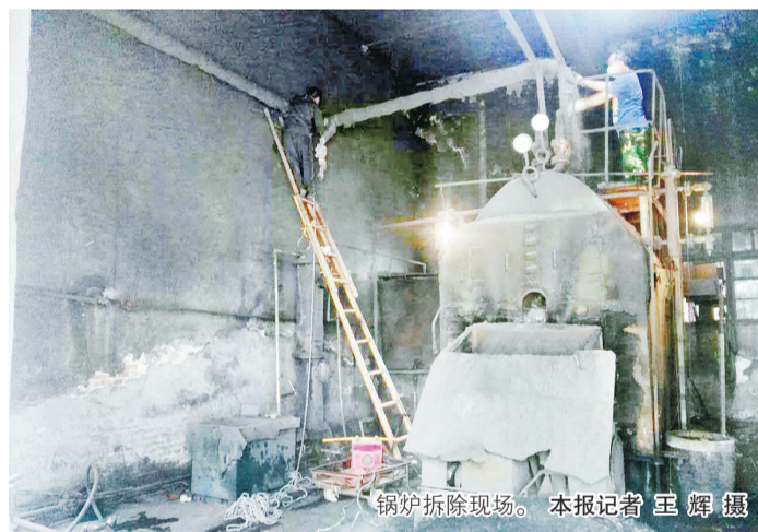
锅炉拆除现场。

本报讯(记者 王辉)在郾城区黄河路西段临河堤的地方有一个企业的小锅炉,清晨时分偷偷排黑烟,时不时还会闻到煤烟味……(详见本报6月21日07版)经过调查,该企业使用的小锅炉是燃煤锅