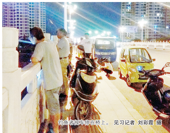
钓鱼者把车停在桥上。

本报讯(见习记者 刘彩霞)近日市民张女士向记者反映,晚上散步路过太行山路沙河大桥,桥上有不少市民趴在桥栏杆边上钓鱼,桥面上也停了不少轿车和三轮车,影响道路畅通和市民的出行安全。