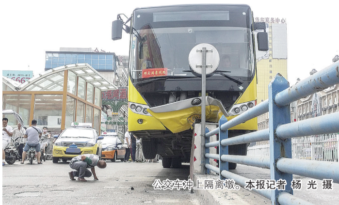
公交车冲上隔离墩。本报记者 杨光 摄

该车司机蔡先生告诉记者:“当时我正驾车要进入铁路涵洞,这时候从公交车左后侧突然窜出一辆轿车,速度飞快。”这个地方很狭窄,只能容纳一辆公交车通过,他立即向右侧猛打方向避让,但距离涵洞口的隔离墩只有两三米远,踩刹车也无法避免与隔离墩相撞。