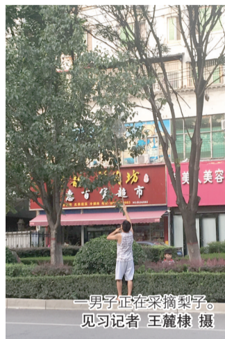
一男子正在采摘梨子。