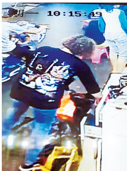
支走店员后,小偷出手偷包。