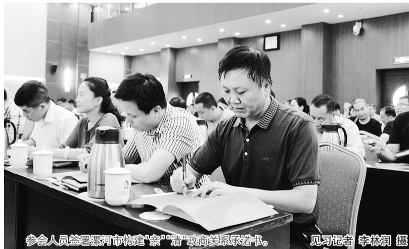
参会人员签署漯河市构建“亲”“清”政商关系承诺书。

据市纪委的领导介绍，党的十八大以来，随着反腐力度的持续加大，政商关系中的陋习得到一定程度的遏制和清理，但“树倒根存”，并且出现了一些新情况、新问题：有的“亲而不清”。彼此之间称兄道弟、勾肩搭背，在工程、土地、项目等问题上违规插手、暗箱操作，搞利益输送。在反腐高压态势下，“圈子意识”更为强烈，并且衍生出权力与利益交易“期货化”的新形式，利益交换更为隐蔽。2013年以来，市纪委监委共立案75件，给予党纪政纪处分55人，处分人员中有受贿行为的占38.2%；查处案件中，涉及企业人员189人，其中有行贿情节的占68.3%，有送礼情节的占31.7%。全市检察机关共立案查处贪污贿赂案件221件，涉案287人，其中涉及企业人员62人，占涉案人数的21.6%。