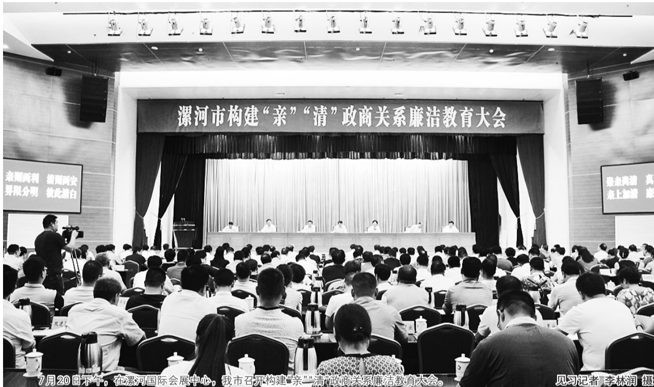
7月20日下午，在漯河国际会展中心，我市召开构建“亲”“清”政商关系廉洁教育大会。

新常态下，如何构建“亲企”“清政”的新型政商关系体系，也自然成了社会各界新的期待、新的焦点。