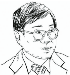
人社部社会保障研究所所长 金维刚

延迟退休应当综合考虑劳动力供需、教育水平、预期寿命等多种因素,统筹协调处理各种关系,其中包括与就业的关系。