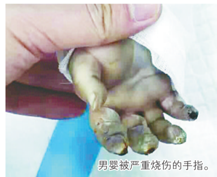
男婴被严重烧伤的手指。

7月24日中午,江苏苏州一名6个月大的男婴,因身体大面积烧伤,被送到苏州大学附属儿童医院救治。7月25日,记者了解到,男婴被烧伤原因是,由于喜欢听电吹风发出的“嗡嗡”声,家长为了哄其开心,开电吹风给他听,结果电吹风吹起火引发意外。