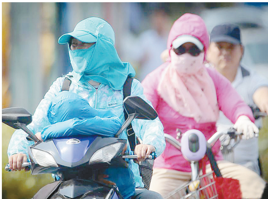
“全副武装”的市民骑着自行车在高温下的南京街头经过。

河南、山东等北方省份也迎来高温。7月26日,河南多地发布高温橙色预警,局部气温达39℃。 晚综