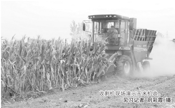
收割机现场演示玉米机收。

在农机介绍员的现场讲解下，第一台联合收割机对试验田里的玉米进行机收演示：收割机收获玉米后，在剥去玉米外衣的同时，直接机械粉碎玉米秸秆还田。每台机器收割完毕，围观的农户都走进地里，观察玉米秸秆粉碎还田的效果。不一会儿，5台玉米收割机收完了12亩试验田的玉米。