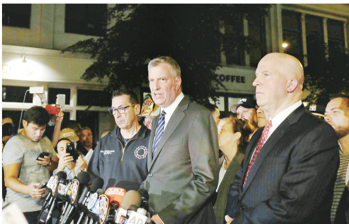
当地时间9月17日，在美国纽约，纽约市长比尔·德布拉西奥（前右二）与纽约警察局局长詹姆斯·奥尼尔（前右一）出席新闻发布会。

在联合国大楼外，4名正在站岗的警察称他们从9月17日下午开始执勤，爆炸事件发生后，他们并未接到任何特别指令。 据新华社