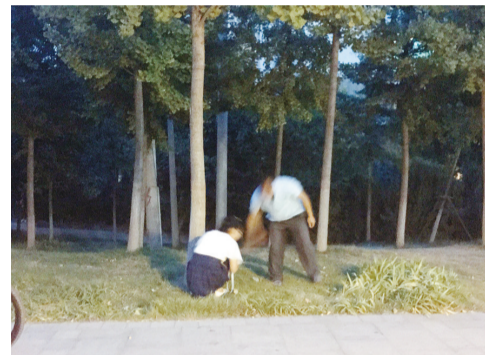
□文/图 本报记者 王麓棣