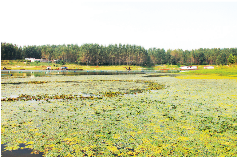
□文/图 本报记者 王辉 李林润 实习生 李博昊