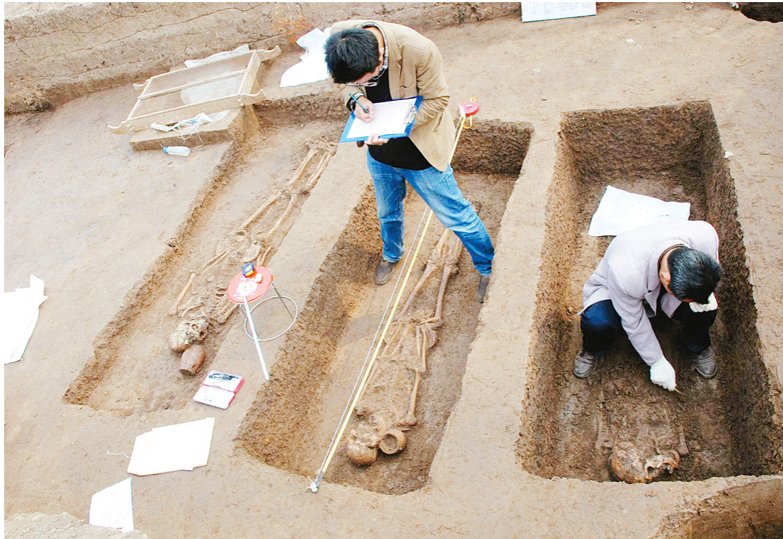
考古人员在贾湖遗址现场考古、挖掘。