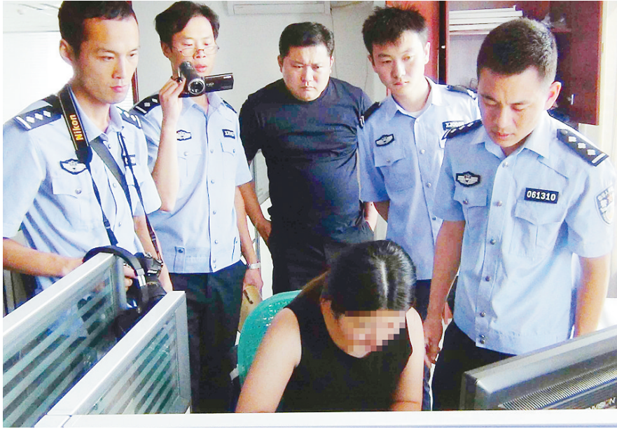
警方实施抓捕时，发现骗子正在网聊。

涉案的这家网络科技公司，招聘了大量工作人员。经过短暂培训后，这些人员上岗。他们每人都申请了不同的QQ号和微信号，并把个人资料中的性别设置为“女”，因为以这样的身份聊天更容易拉来客户。