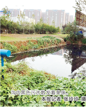
沟内黑色污水散发着臭味。

本报讯（记者 张玲玲）“俺家东边有一个小水沟，颜色跟墨汁一样，而且最近老是散发臭味。”10月19日，市民潘先生拨打本报新闻热线3139148反映，希望臭水沟能早日得到治理，还附近居民一个良好的居住环境。