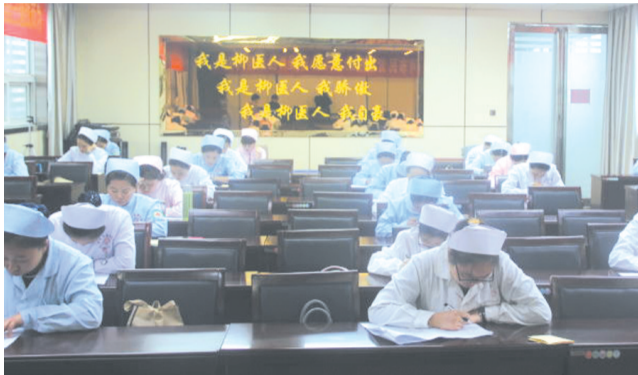
图为护理知识考试现场。