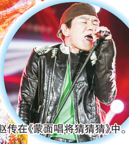
赵传在《蒙面唱将猜猜猜》中。