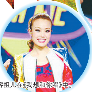
容祖儿在《我想和你唱》中。