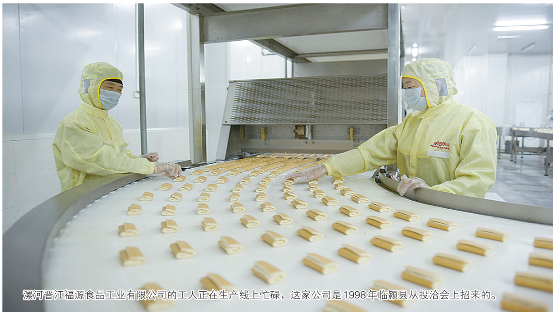
漯河晋江福源食品工业有限公司的工人正在生产线上忙碌, 这家公司是1998年临颖县从投洽会上招来的。