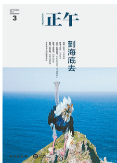
正午故事 编 台海出版社 2016年出版

世界仍然生活在故事当中，但以遗忘、抹灭大多数故事为代价。今天中国最主要的故事，是关于财富和成功的故事，《正午》的编辑们则试着抵御这种单一，寻找被忽视的故事，比如：唱二人转的四平艺人、柏林市区的野猪与大闸蟹，最火热的直播女孩，玩机核的少年，斗鸡江湖中的高手以及一场普通纵火案等。这些故事都一个名称：非虚构叙事。非虚构这门技艺——在现实生活、作者和读者之间，制造出一个文字的场，三者互相牵引，紧张又优美，不