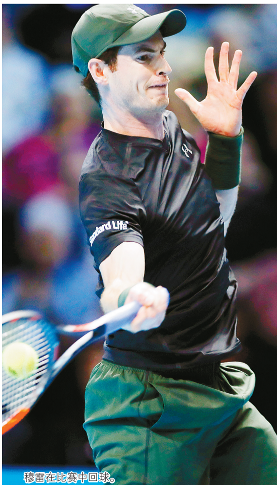
穆雷在比赛中回球。