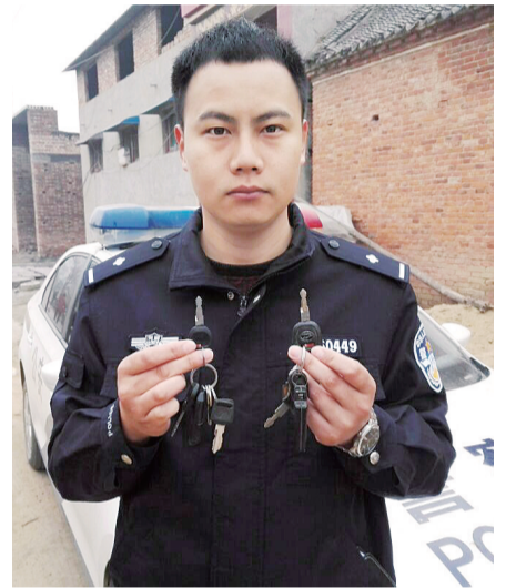
民警展示两辆电动车的钥匙，看上去有些相似。

白：粗心大意的王先生认不清自己借来的电动车，恰好手里的钥匙又是把一插即用的“万能钥匙”，才闹了这一出“盗窃”电动车的乌龙剧。最后王先生对陈老汉和民警表达了歉意，然后把陈老汉的电动车还回。民警则提醒陈老汉及时更换一把新锁，以免电动车失踪剧情再次上演。