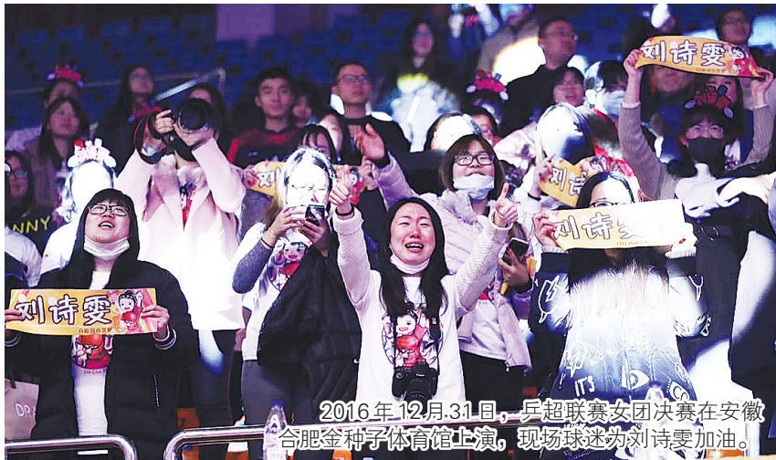
2016年12月31日,乒超联赛女团决赛在安徽合肥金种子体育馆上演,现场球迷为刘诗雯加油。

历时两个半月,本赛季乒超联赛终于赶在2016年的最后一天画上了句号,八一男队二度称雄,武汉女队首度折桂。奥运年的缘故,2016年乒超联赛得到了前所未有的关注,高水平赛事回馈了球迷们热情,VR(虚拟现实)技术的应用也体现出联赛在提升观感方面的探索。不过同样需要看到,乒超联赛的商业开发依然有很长的路要走。