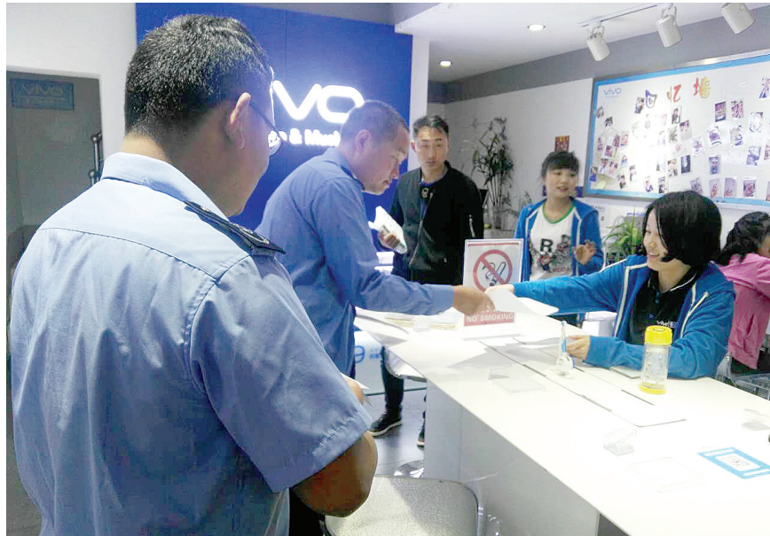
执法人员要求商家不要使用高音喇叭。