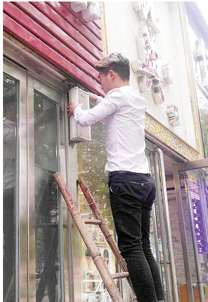
商户拆除高音喇叭。

“今天中午,我们去学校教学楼实地测了测,文化路上有六家商铺的高音喇叭能传到教室,有些商铺的高音喇叭站在五一路上都能听见。”5月15