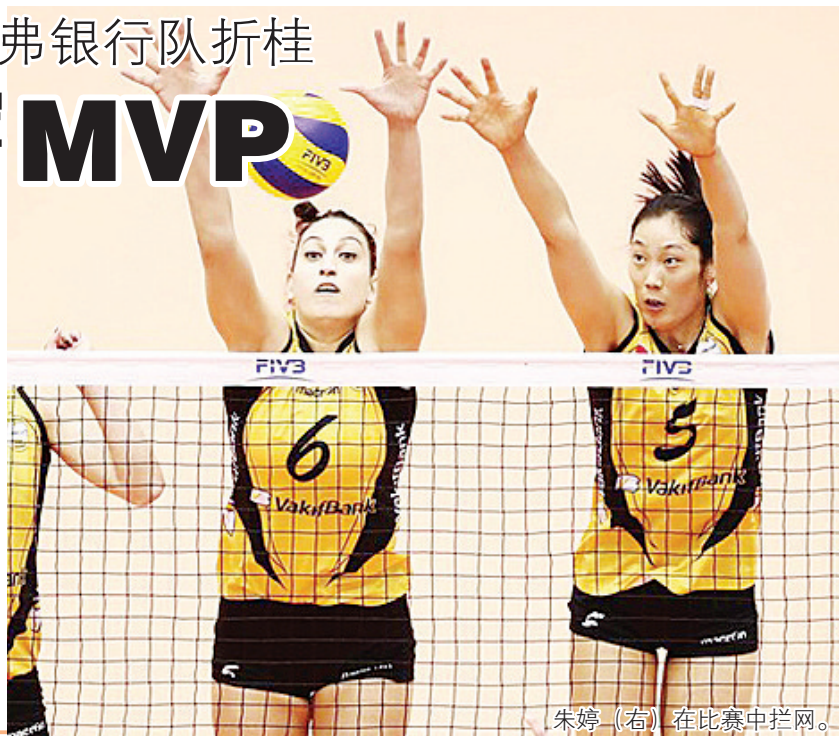
朱婷(右)在比赛中拦网。

2017年世俱杯女排赛决赛5月14日晚在日本神户战罢,中国球员朱婷效力的土耳其瓦基弗银行队以3:0(25:19、25:21、25:21)横扫南美洲冠军巴西舒耐队,时隔四年重夺世俱杯赛冠军。朱婷成为首位夺得世俱杯女排赛冠军的中国球员,她在决赛中独揽19分荣膺“得分王”,并收获本次比赛的“MVP”(“最有价值球员”奖),并入选最佳阵容。