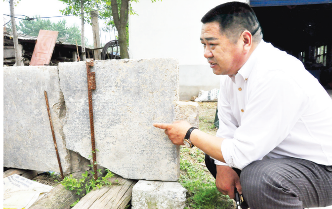
村里保存着多块介绍砖桥历史的石碑。