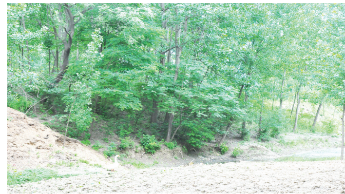
绕村而建的寨墙是这个古村落历史的见证。如今村里遗存的寨墙受到了保护。