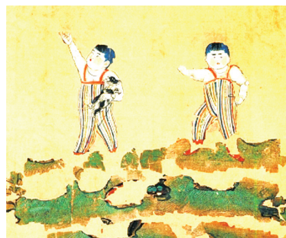
新疆吐鲁番市阿斯塔那187号唐墓中出土的绢画上的儿童。

冠礼是给男性的，女性成年礼仪叫“笄礼”。《礼记·内则》称：“十有五年而笄，二十而嫁。”意思是，女性十五岁举行笄礼，二十岁可嫁人，十五岁女孩因此被称为“及（开）笄之年”。也就是说，女性十五岁以下算未成年人，但事实上，这一标准并没有被严格遵