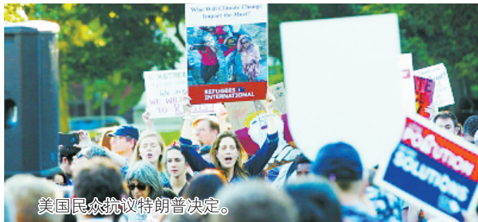
美国民众抗议特朗普决定。