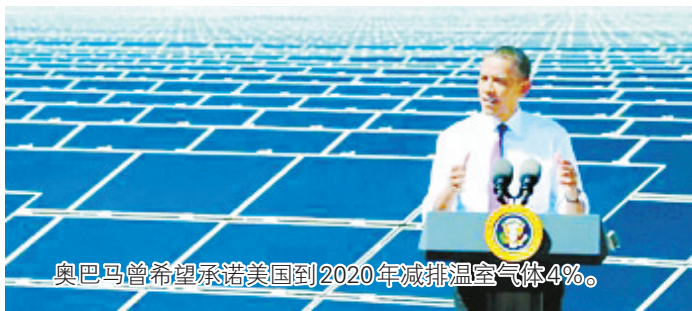
奥巴马曾希望承诺美国到2020年减排温室气体4%。