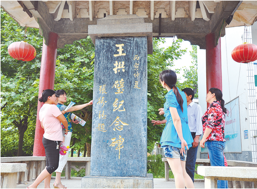
位于召陵区青年镇中学院内的王拱璧纪念碑。