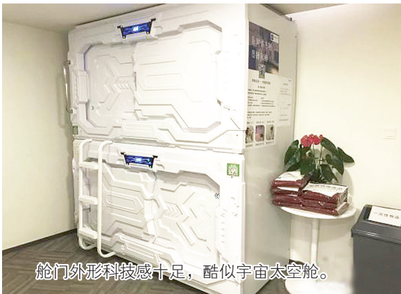
舱门外形科技感十足，酷似宇宙太空舱。

从自行车、充电宝到雨伞，“共享”概念在无形中改变着我们的生活方式。近日，上海一些写字楼内出现了“共享睡眠舱”服务，用户通过扫描二维码即可“入舱”休息，计费标准每分钟为0.2元，30分钟起。