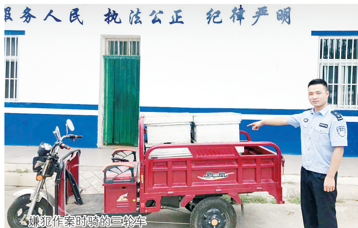
嫌犯作案时骑的三轮车