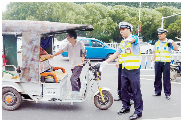
执勤交警劝导违规行驶三轮车。

本报讯(记者 杨光) “您好，您现在是骑车逆向行驶，按照规定要罚款20元。”7月27日下午5点，在市区淞江路与黄山路交叉口处，市民张先生骑着电动车，从路北人行道向东行驶，他准备通过十字路口时，被执勤交警拦住。“目前我市正在开展交通违法行为集中治理行动，所有违反交通规则的行为都要进行处罚，请您配合。”在民警进行耐心解释后，张先生认识到了自己的错误，并交了罚款。