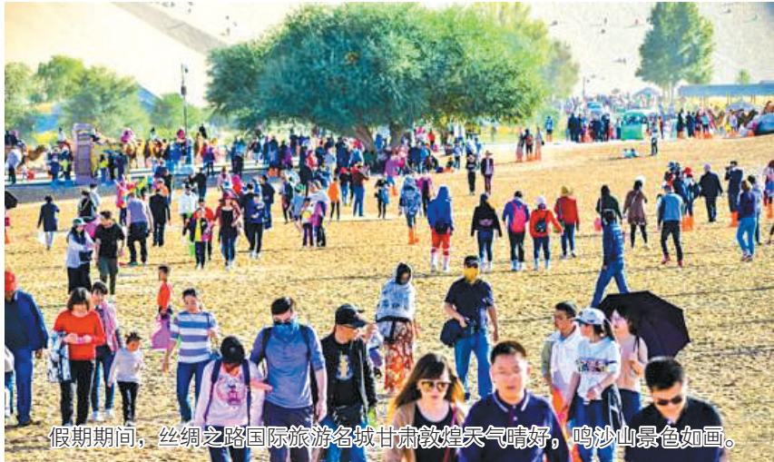
假期期间，丝绸之路国际旅游名城甘肃敦煌天气晴好，鸣沙山景色如画。