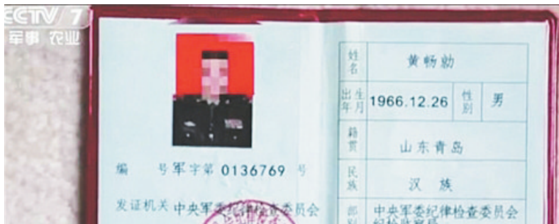
↑警方收缴的假证件。