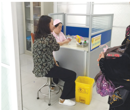
在市疾病预防控制中心门诊部，一位市民正在等待注射狂犬疫苗。