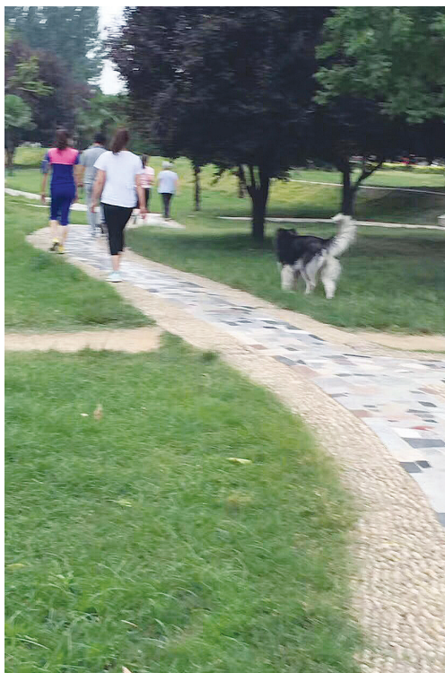
一条未拴链大型犬在公共绿地撒欢。

“每天来我们这里打狂犬疫苗的人不少，多的时候有二三十人。天气炎热的时候被宠物伤到的人较多，猫狗也难耐酷暑，性情会变得狂躁，就连平时比较温顺的宠物也容易闹脾气，而且这时候人们穿得薄，很容易被猫狗伤到。”谢医生告诉记者，来注射狂犬疫苗的成年人较多，而且多是被自己家中的宠物伤到。如果被猫狗咬伤，要用肥皂水与流动清水交替清洗伤口至少15分钟，然后用碘伏、酒精等进行消毒，并尽早注射狂犬疫苗。