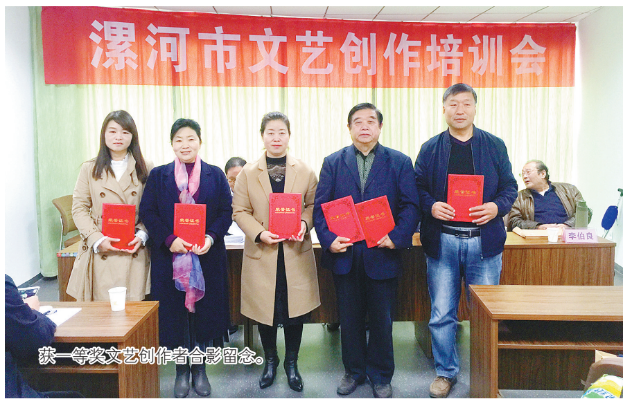
获一等奖文艺创作者合影留念。