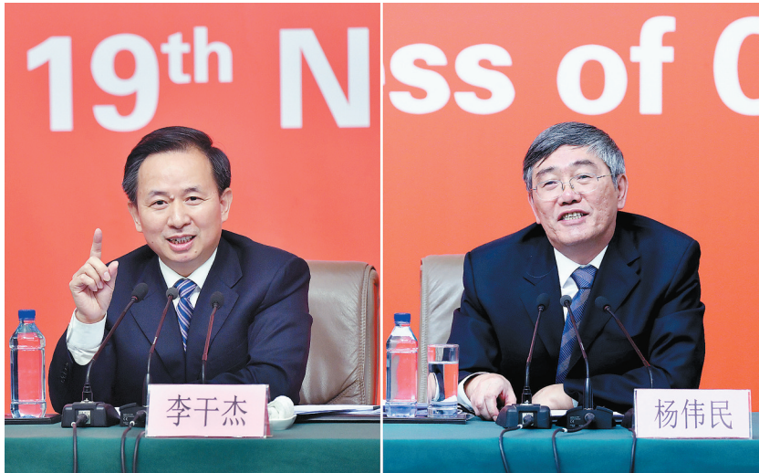
10月23日,十九大举行第六场记者招待会,环境保护部党组书记、部长李干杰,中央财经领导小组办公室副主任杨伟民答记者提问(拼版照片)。

党的十九大新闻中心23日下午举行第六场记者招待会,十九大新闻发言人郭卫民邀请环保部党组书记、部长李干杰,中央财经领导小组办公室副主任杨伟民,围绕“践行绿色发展理念,建设美丽中国”介绍情况,并回答记者提问。