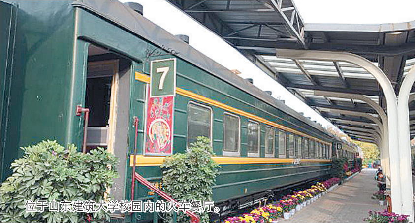
位于山东建筑大学校园内的火车餐厅。

近日,位于山东建筑大学校园内的火车餐厅在社交网络上“走红”。不少网友对“退役”的绿皮火车“变身”餐厅感到新奇,同时也纷纷对这一工业遗产保护再利用的形式点赞。