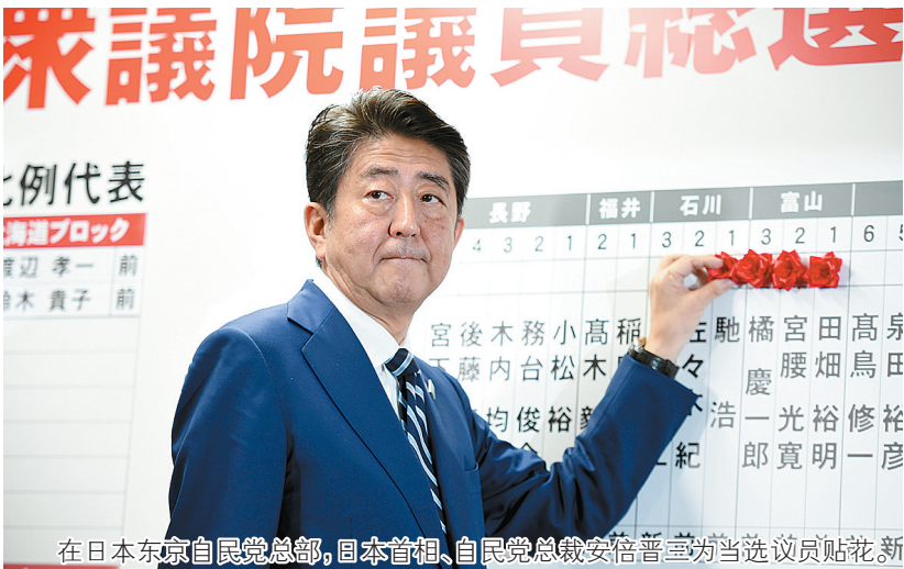
在日本东京自民党总部,日本首相、自民党总裁安倍晋三为当选议员贴花新