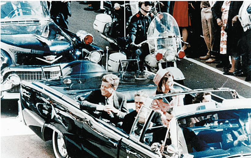
肯尼迪遇刺前乘坐敞篷车。