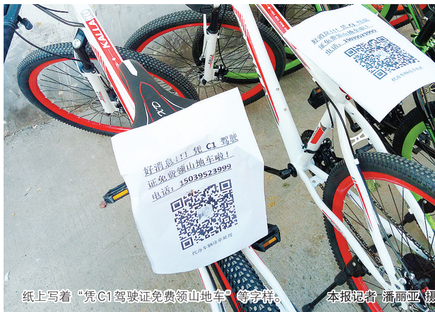
纸上写着“凭C1驾驶证免费领山地车”等字样。