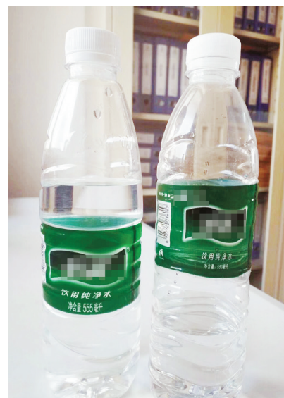
两瓶外包装相似、品牌不同的矿泉水。

记者就此采访了市知识产权局的相关负责人。该相关负责人告诉记者，如果该知名品牌矿泉水有外观设计专利，那么出现这种情况，他们可以到市知识产权局投诉对方专利侵权;如果没有外观设计专利，抄袭知名品牌矿泉水外包装则属于傍名牌，有意误导消费者，是一种不正当竞争，一经查实工商部门会给予责任方相应的处罚。