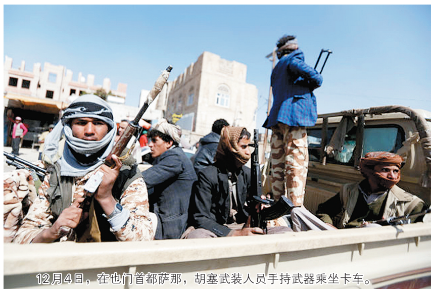
12月4日，在也门首都萨那，胡塞武装人员手持武器乘坐卡车。

也门胡塞武装12月4日宣称，已经杀死前总统阿里·阿卜杜拉·萨利赫。与此同时，沙特阿拉伯媒体援引萨利赫方面消息人士的话报道，萨利赫已身亡。胡塞武装与支持萨利赫的武装曾经结盟，但如今反目，有可能彻底改变呈僵持状态的也门内战。