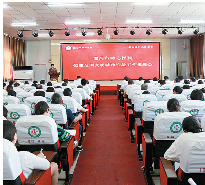
漯市中心医院召开“创文”推进会。