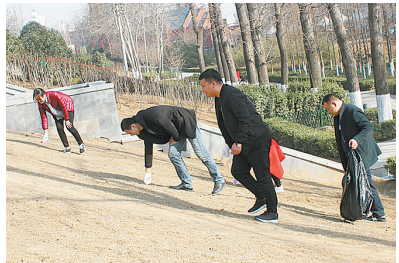
漯河市移动公司组织志愿者开展“爱绿护绿我行动，洁化美化我参与”志愿服务活动。