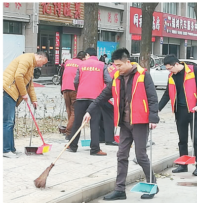
召陵区卫生清扫活动。