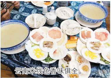
云南米线色香味俱全。

在风景大美的云南，蒙自市丝毫没有名气，如果不是《芳华》在此取景，恐怕现在还没有多少人知道这个地方。 蒙自市，位于云南省东南部，红河州东部，面积不大，也不太发达，却是一座极富历史意义的小城。自古以来，蒙自就是云南的历史名城，尤其在清末民初，这里成为云南第一个海关，建立了云南近代工商业文明。人们在这里建立了：邮局，火车站，电报局等，至今这里还有法国租借遗址，可谓是一座充满法式风情的小城。 而电影里出现的火车站，便是取景蒙自的碧色寨，这个站台已有100多年的历史了，至今保留着原来的样貌。抛开蒙自悠久的历史渊源，蒙自其实还是一个特别适合生活的城市。小城不大，人口也不多，与纷繁喧闹的大城市想比，这