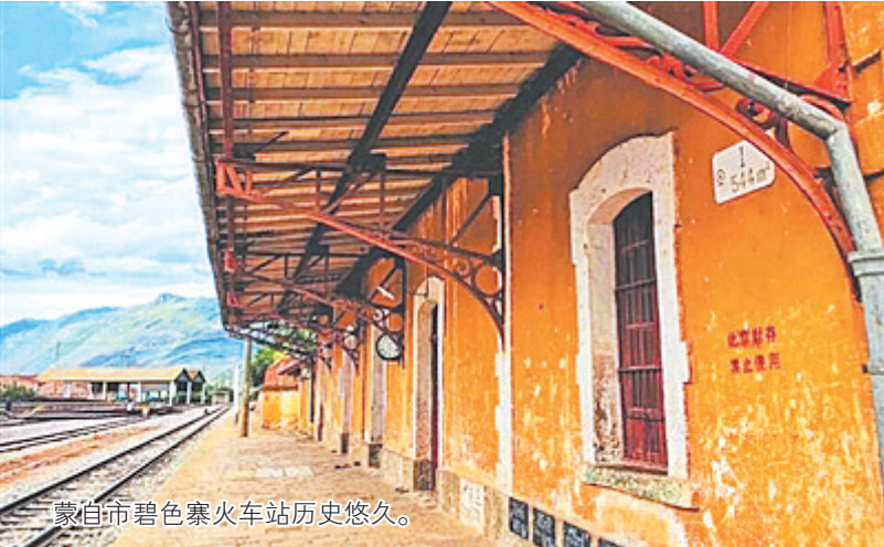
蒙自市碧色寨火车站历史悠久。

一部电影《芳华》受到好评。除了票房飘红，主创人员大火之外，就连《芳华》的取景地也跟着火了起来。人们纷纷好奇，电影里极具年代感的场景到底是在哪里拍的？ 经过记者一番研究之后，终于找到了这个低调的取景之地——云南省蒙自市。