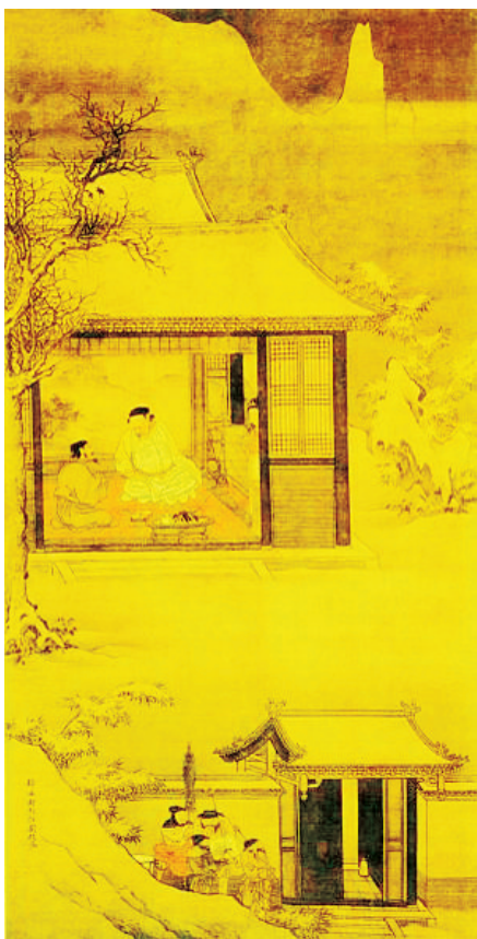
雪夜访谱图(明·刘俊绘。现藏于北京故宫博物院)