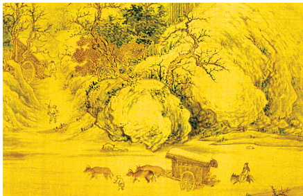
古人下雪天出行(《溪山行旅图》局部,宋·朱锐绘)