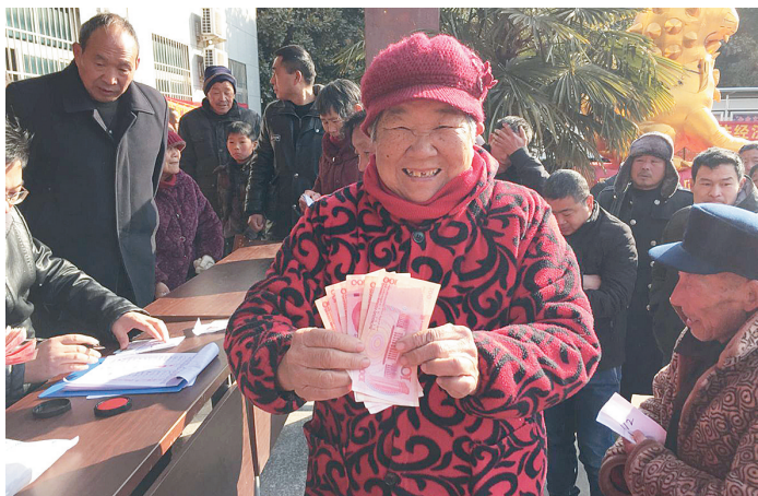
一位老人领到分给她们家的现金。

本报讯(记者 张玲玲)2月8日上午,源汇区干河陈乡三里桥村举行了第八届老人节暨三里桥实业有限公司分红仪式,为村内近500名老人分发了大礼包:米、面、油、肉等生活物资和300元现金。当天,180户村民股东分红150万元。