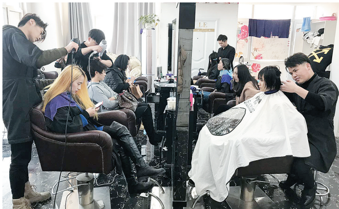
一家理发店内坐满了正在做头发的顾客。